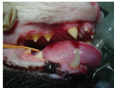
Gato com o dente canino superior fraturado

animais de exposição, que precisam ter todos os dentes presentes para poder participar de competições da cinofilia.