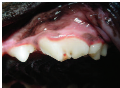
Quarto pré-molar superior de cão com fratura com exposição da polpa (ponto vermelho sangrando)

Diferentemente do que acontece na odontologia humana, cães e gatos possuem dentes para os quais não se recomenda tratar o canal. São dentes pequenos, de difícil acesso e de pouca importância funcional e até mesmo estética. Nos gatos, normalmente, só se trata o canal dos dentes caninos. Nos cães, além dos dentes caninos, também são tratados os incisivos, os grandes pré-molares e os grandes molares. Os demais dentes fraturados são extraídos, por ser esse o método mais viável e seguro para o paciente. Exceções à regra são os casos de